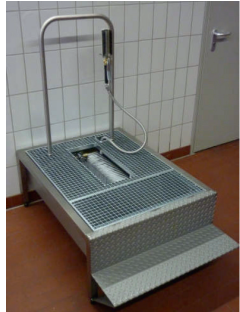
Afbeelding: STW 337-B met steunbeugel

Aan de voorkant van de uitsparing zit een automatische waterstopkraan die met de punt van de voet wordt bediend. Zijdellingse spoelpijpen leiden het water over de borstels op het schoeisel. Een waterdoorvoerende handborstel maakt extra reiniging van de schacht van de laars of andere te reinigen onderdelen mogelijk. Een in de kuip geïntegreerde afvoer met slibvangput en stankafsluiter zorgt voor een optimale afvoer van vuil water en een gescheiden opvang van grof vuil. Voor eenvoudige reiniging kan het rooster aan de voorkant uit het apparaat worden verwijderd.