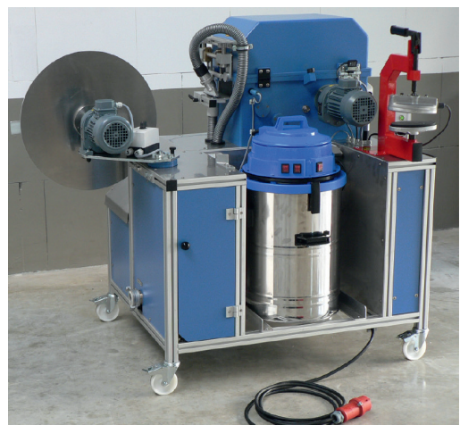
Wikkelmachine in zwevende uitvoering voor gelijktijdig wassen en opwinden of zijwaarts gedraaid naast de SPZ voor het enkel of dubbel opwinden van de slangen. Bediening via voetschakelaar.