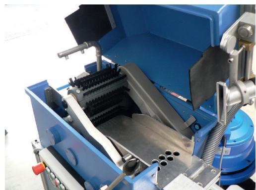
Korte, harde borstelharen zorgen voor een optimale reiniging en een lange levensduur.