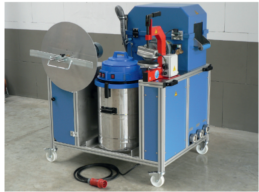
Vulkaniseerinstallatie aan de zijkant achter de slangenwasmachine