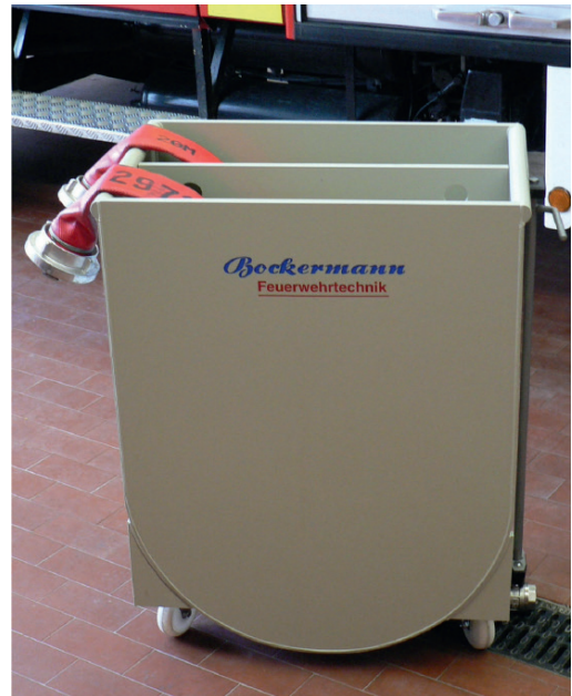
Voorweekbak EWT-PP 4/8

Het mobiele slangenonderhoudseenheid SPZ 172 is geschikt voor het voorweken, reinigen, testen, drogen en opwinden van brandslangen van de maten 25 tot en met 110 mm.